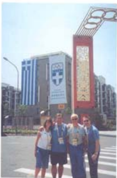
Οι Έλληνες γιατροί μπροστά στο Ελληνικό Σηλ.

Το απόγευμα συνεχίζαμε τη δουλειά στο ιατρείο και φυσιοθεραπευτήρια ή βλέπαμε λίγη τηλεόραση, αφού είχαμε 40 Ολυμπιακά κανάλια 24ωρης κάλυψης στη διάθεσή μας. Κάθε βράδυ μετά τις 10 πήγαινα στο γυμνασίο γυμναστήριο. Κλείναμε το ιατρείο αργά και συχνά τακτοποιούσαμε μέχρι τις 2 τη νύχτα. Ανυπομονούσα να αρχίσουν οι Αγώνες. Τις τελευταίες τρεις ημέρες πριν από την έναρξη, με πολλή ζέση και απαιστική υγρασία να