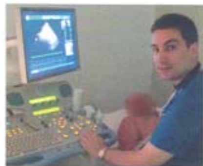
Επί το έργον στην Ποδηλατική του Χωριού.

Η Ποδηλατική του Χωριού ήταν δίπλα στο σπίτι μας και πολύ καλά εξοπλισμένη. Το ιατρικό και νοσηλευτικό προσωπικό ήταν ευγενικό και πρόθυμο να βοηθήσει,