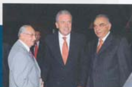
Ο Υπουργός Υγείας κ. Δημήτριος Αβραμόπουλος με τον Πρόεδρο του Δ.Σ. Καθηγητή κ. Ι. Παπαδημητρίου και τον ι. Γενικόχειρουργό κ. Γρίβα.