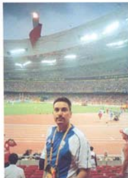
Μέσα στο Στάδιο

Πριν το καταλάβουμε οι Αγώνες έφτασαν στην τελευταία τους ημέρα. Στην Τελετή Λήξης στις 24 Αυγούστου ντυθήκαμε με απλές φόρμες και μπήκαμε με όλους τους αθλητές, ενωμένοι και χωρίς εθνικές διακρίσεις, μέσα στο Στάδιο. Η συγκίνηση ήταν μεγάλη όταν η Ολυμπιακή σημαία πέρασε στο Λονδίνο και η Φλόγα έσβησε, για να ξανανάψει σε τέσσερα χρόνια. Χορεύοντας με τους εθελοντές σε μια τεράστια conga line βγήκαμε, αφήνοντας πίσω την 29η Ολυμπιάδα. Όταν αποχαιρέτησα τους εθελοντές (φίλους μου πια) του σπιτιού μας δεν μπορούσα να συγκρατήσω τα